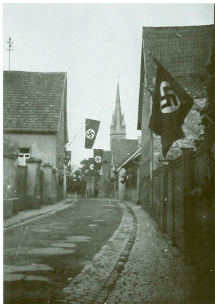
Nur wenige Jahre nach dem Lobpreis auf die demokratische Verfassung von Weimar mussten die alten hessischen Farben durch die Hakenkreuzfahne ersetzt werden

Der historische Kern des Oberdorfs ist eine der wenigen Straßen in Heidesheim, der sein Gesicht im Wandel der Zeit bis heute unverwechselbar erhalten hat. Die markante Folge von Wirtschafts- und Wohngebäuden war seit Generationen für unsere Region typisch und unverwechselbar. In heimischem Kalkstein aufgemauert wurden die Wohngebäude mit Biberschwanzziegeln, die Wirtschaftsgebäude mit Hohlziegeln abgedeckt. (Seit der Mitte des 19. Jahrhunderts wurden bei Aufstockungen Ziegelsteine benutzt.) So bildete sich über Generationen die uns vertraute Ansicht des Oberdorfs mit den alten, harmonischen Häuserzeilen und dem Kirchturm der Pfarrkirche im Hintergrund. Unverwechselbar.