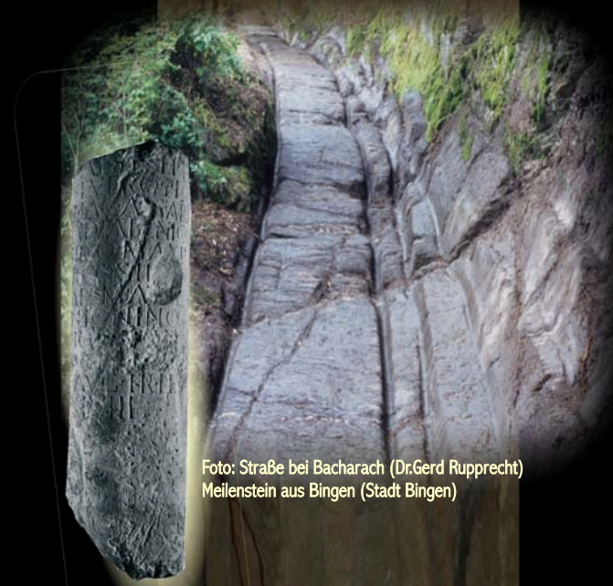
Foto: Straße bei Bacharach (Dr. Gerd Rupprecht) Meilenstein aus Bingen (Stadt Bingen)